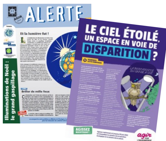
Les campagnes d'Agir pour l'Environnement contre la pollution lumineuse

Ainsi, notre campagne récente sur la protection des haies rappelle l'importance de ces dernières pour les espèces nocturnes ou semi-nocturnes. De même, lors de la création d'Obligations Réelles Environnementales (la protection juridique de la biodiversité d'un terrain pour une durée allant jusqu'à 99 ans et ce même en cas de cession), un paramètre sur la pollution lumineuse est proposé lors de la signature des actes.